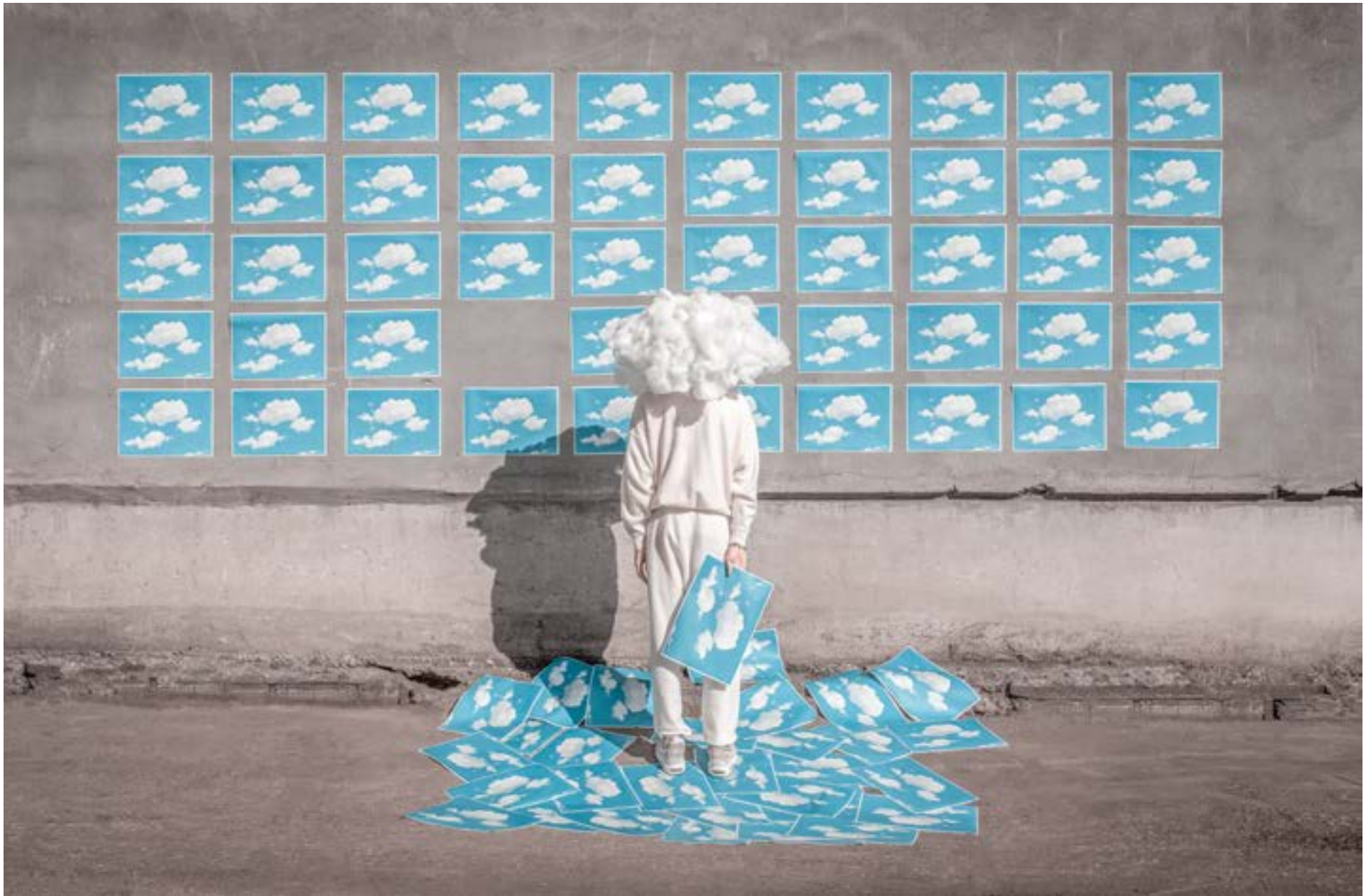
Le Paon Atypique La Quête - 40x60 - 700€ 15 ex - impression sur papier d'art