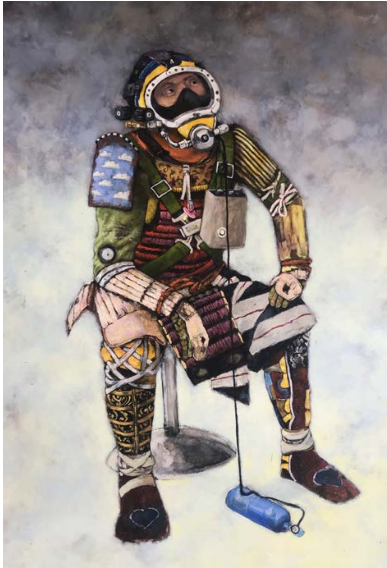
Eric Raban Correspondance -90X140 - Acrylique Acrylique sur toile