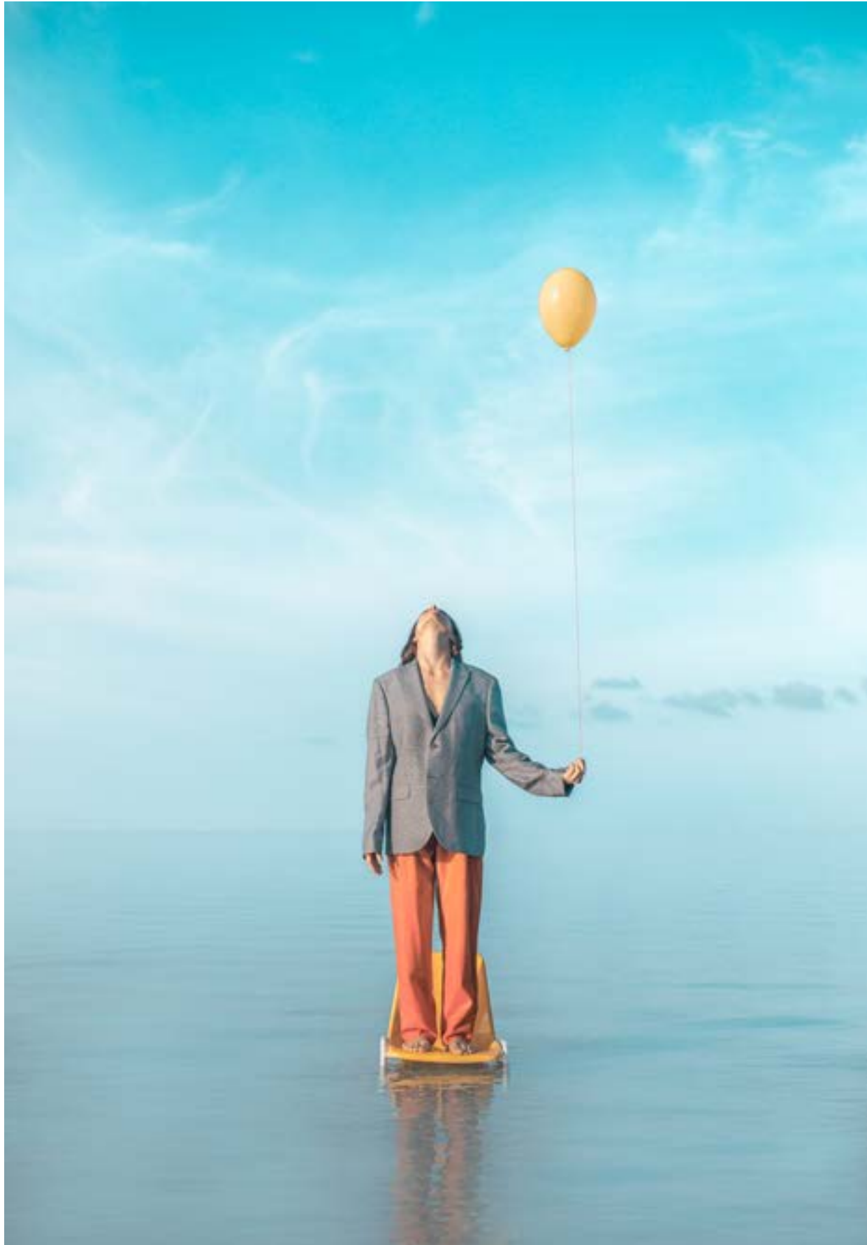
Le Paon Atypique Exile - 40x60 - 700€ 15 ex - impression sur papier d'art