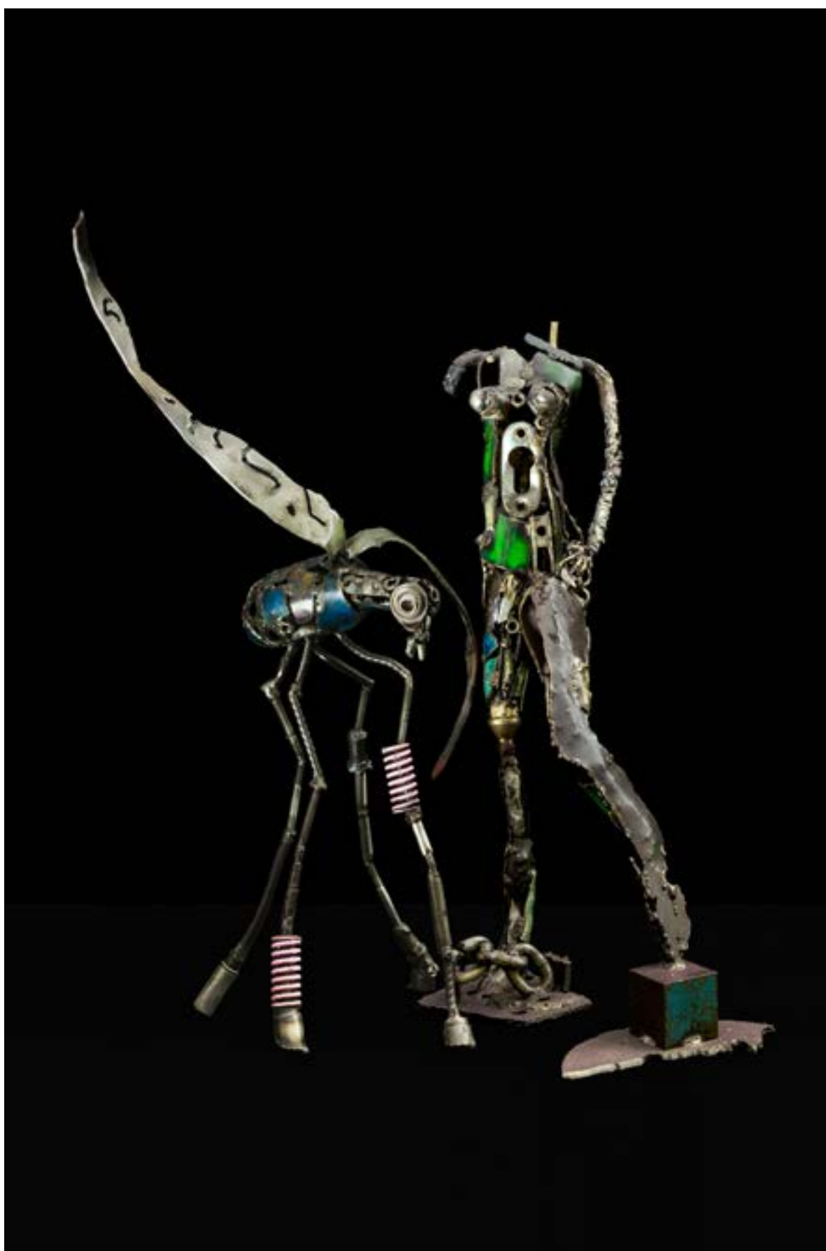
JO'M Aëlle sculpture fer