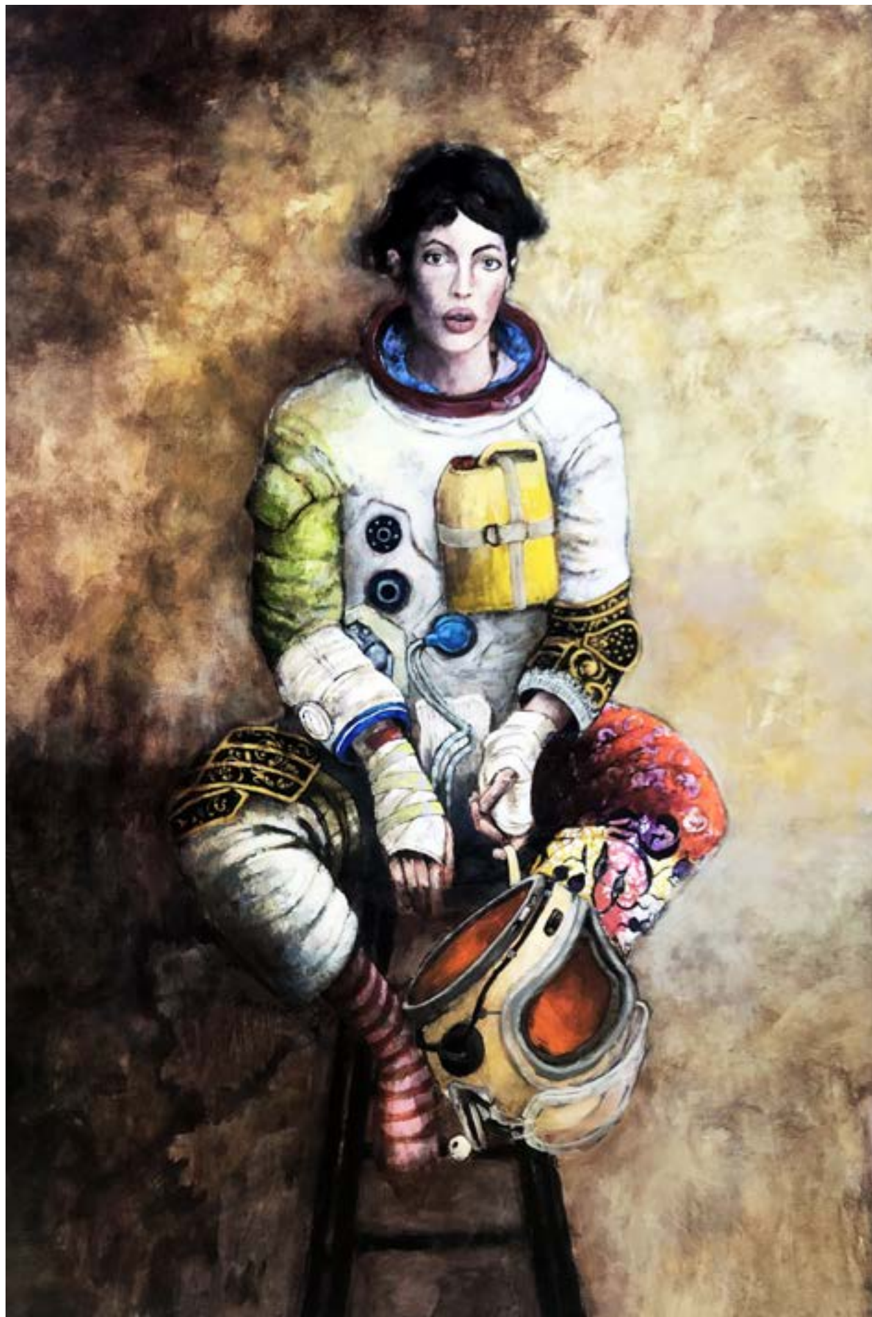
Eric Raban The long tomorrow - 90X140 - Acrylique Acrylique sur toile