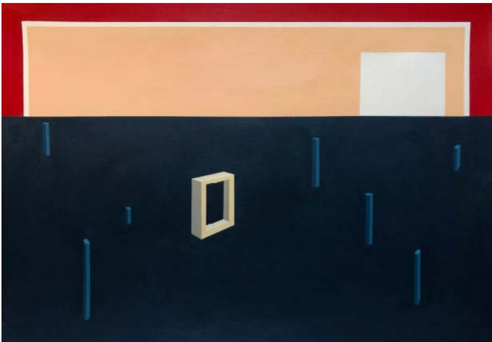
Nicolas PONCET - Fever Dream- 42X29,7 - Acrylique sur papier à grain toilé