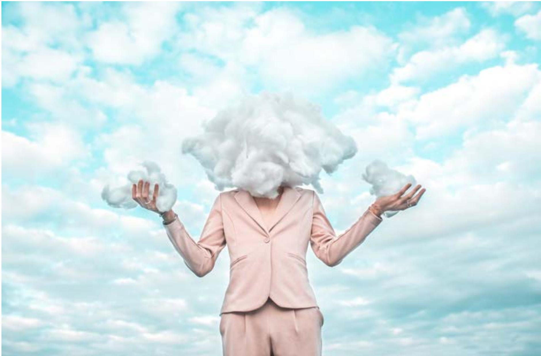
Le Paon Atypique Le créateur - 40x60 - 700€ 15 ex - impression sur papier d'art