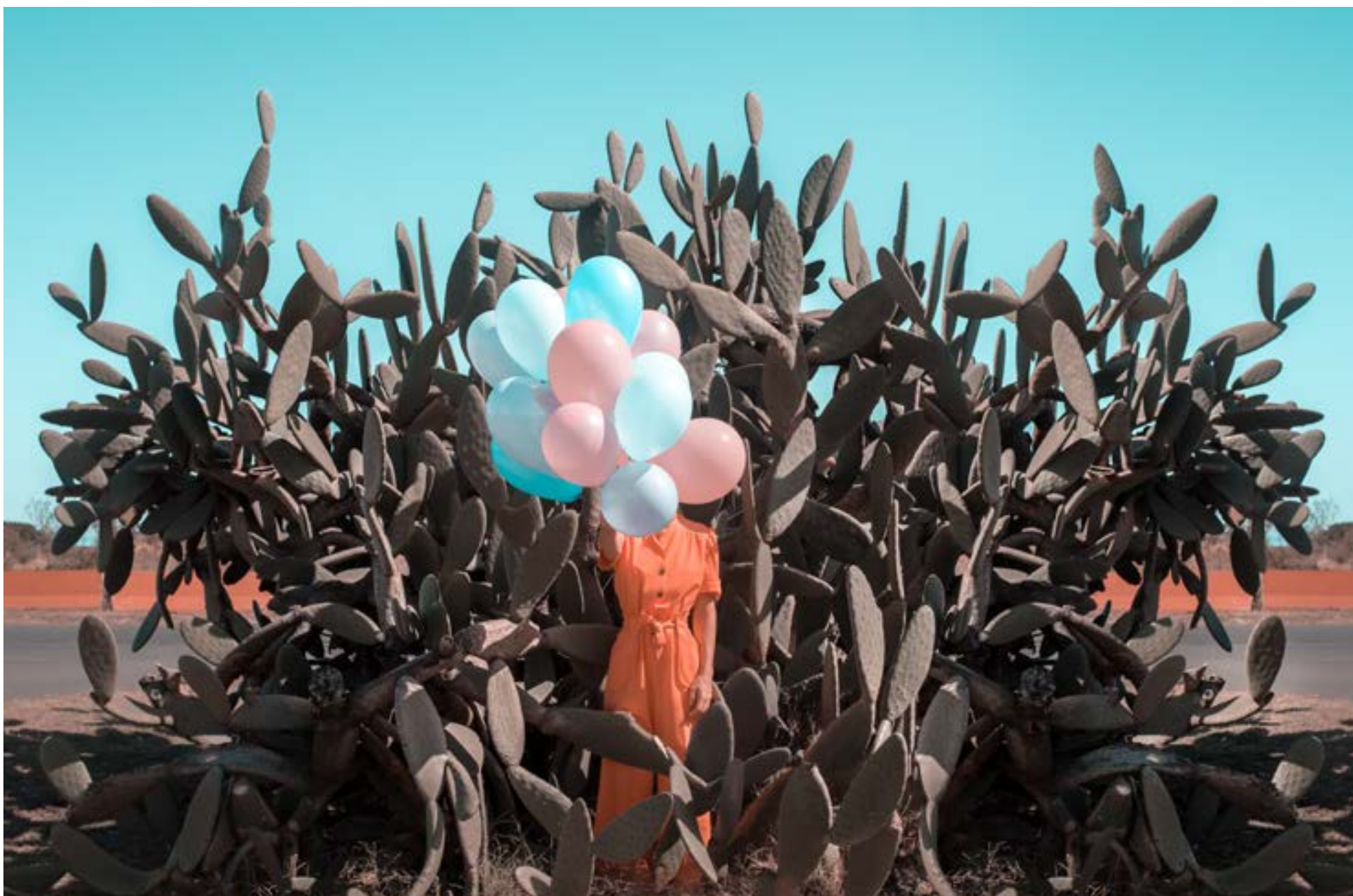
Le Paon Atypique Apprivoiser ses Limites - 40x60 - 700€ 15 ex