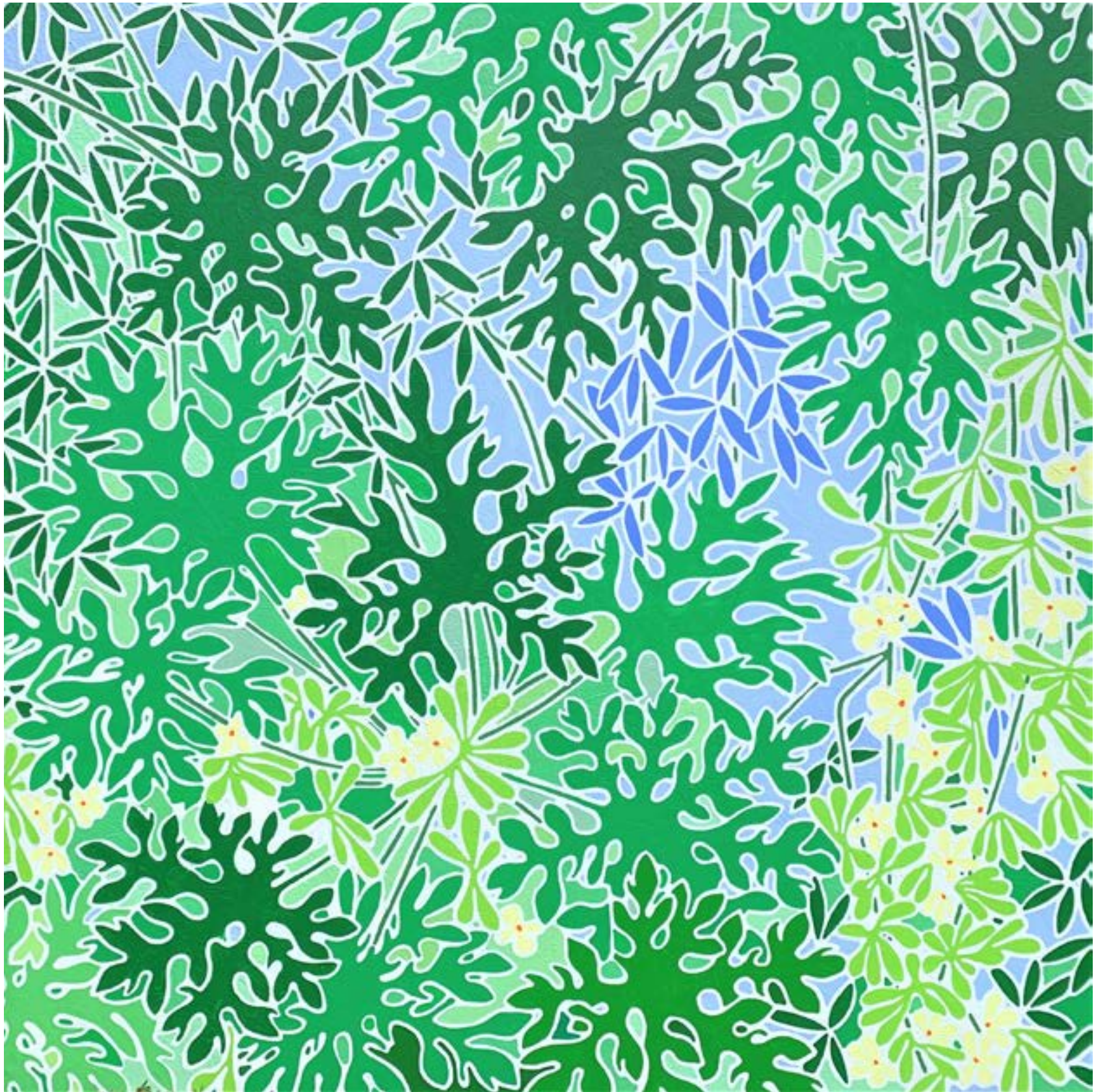
Christophe VERGÉ - RIVIERE DU MAT- 150X150 - Acrylique sur toile 2000€