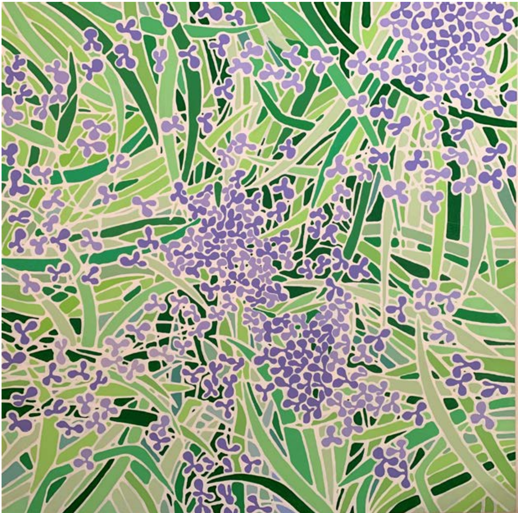
Christophe VERGÉ - RAVINE ST GILLES- 100x100 Acrylique sur toile 1200€