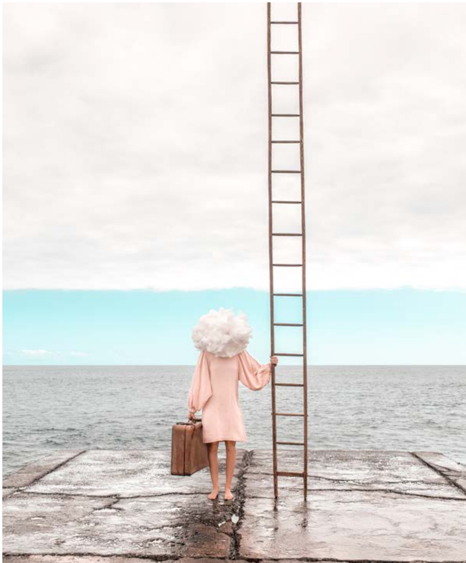
Le Paon Atypique Echappatoire - 40x60 - 700€ 15 ex - impression sur papier d'art