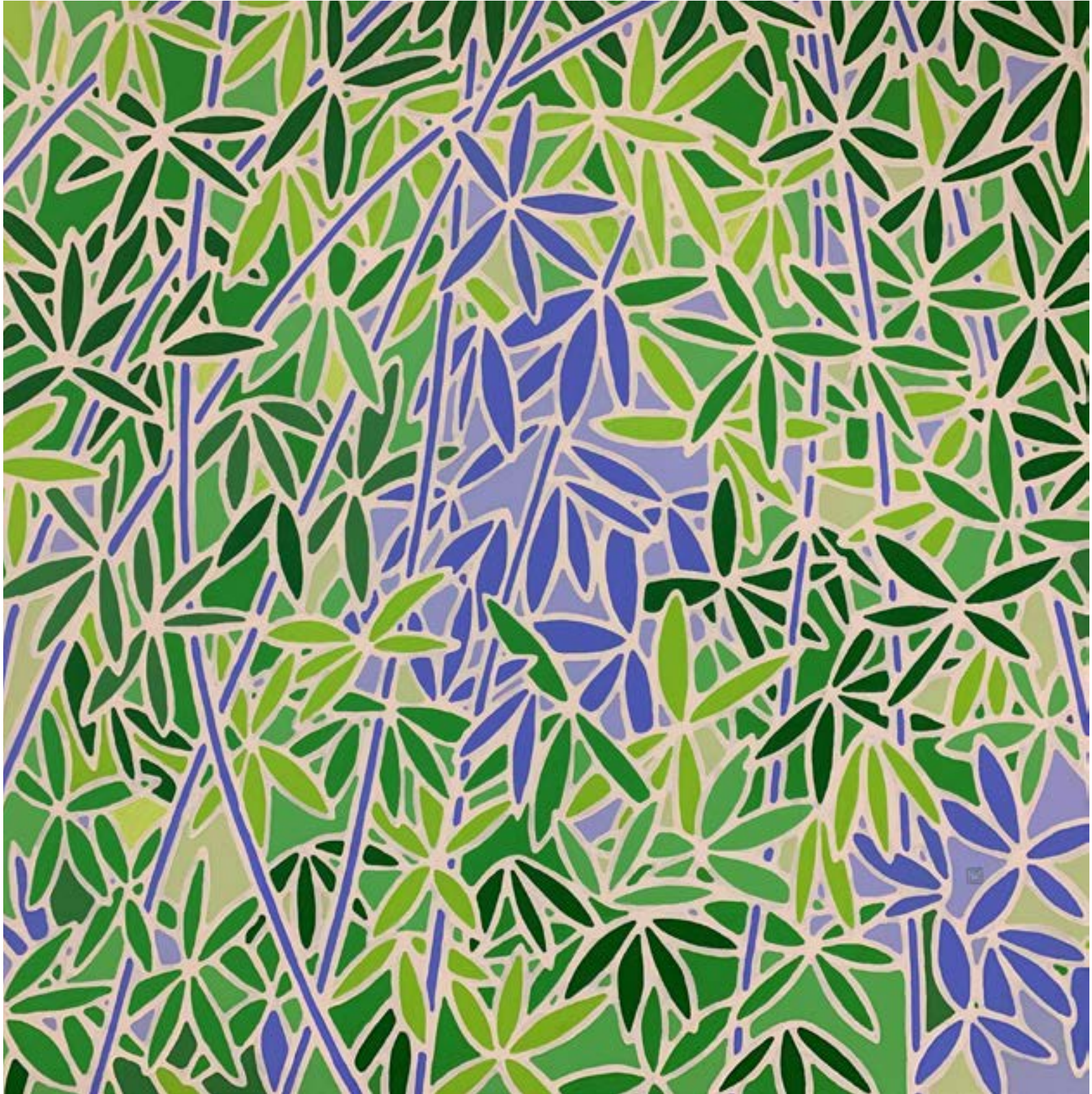
Christophe VERGÉ - RIVIÈRE STE SUZANNE- 100x100 Acrylique sur toile 1200€