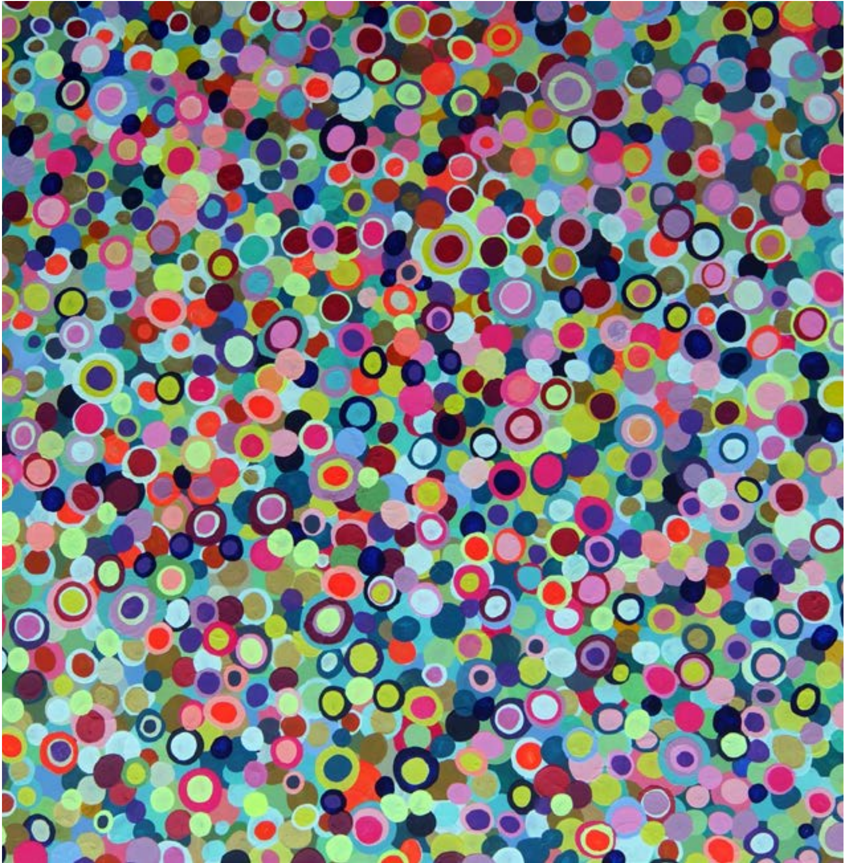
Lionel LAURET Plutonium Jam - 2700€ 100X100 Acrylique sur toile