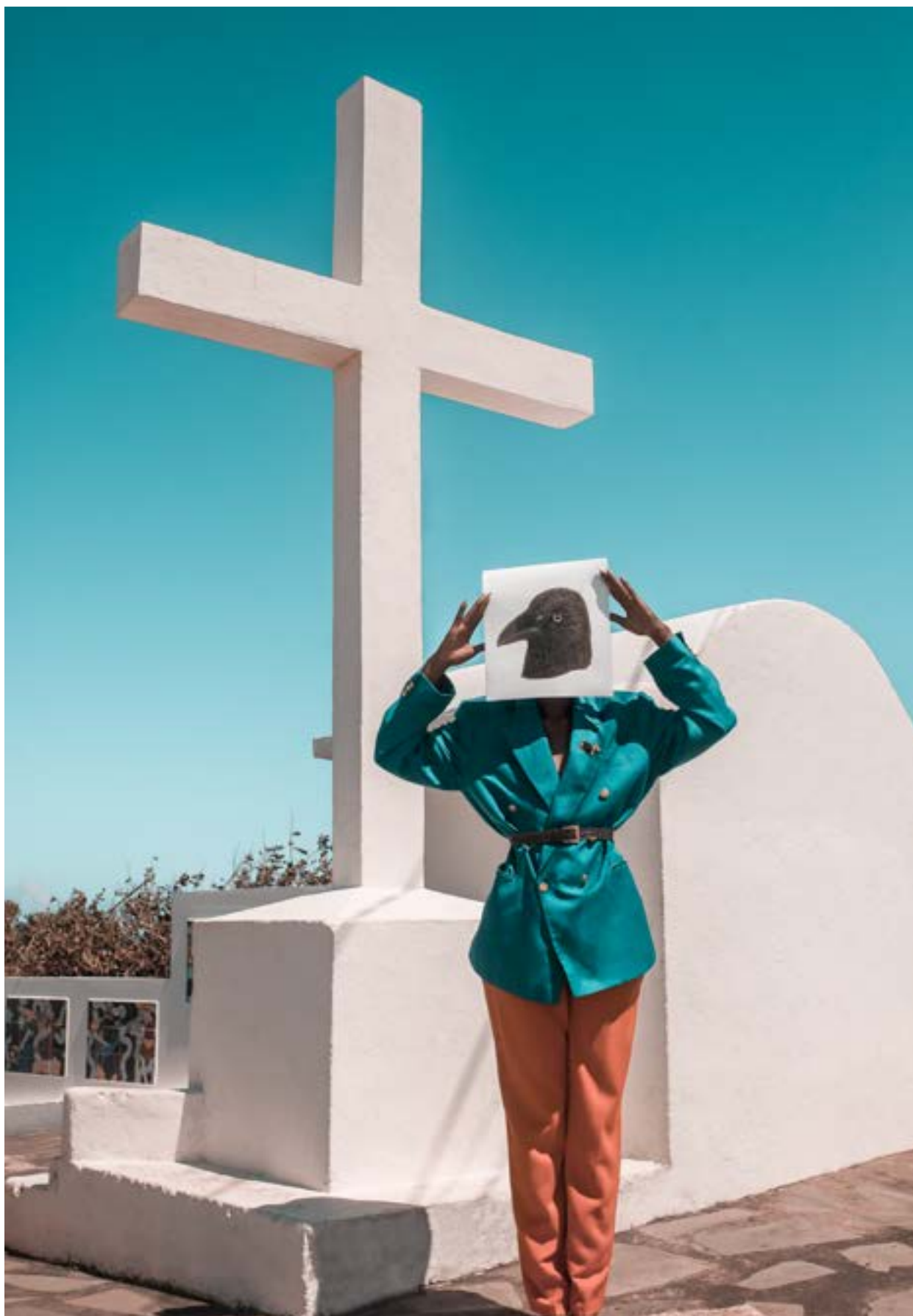
Le Paon Atypique La dernière rencontre - 40x60 - 700€ 15 ex - impression sur papier d'art