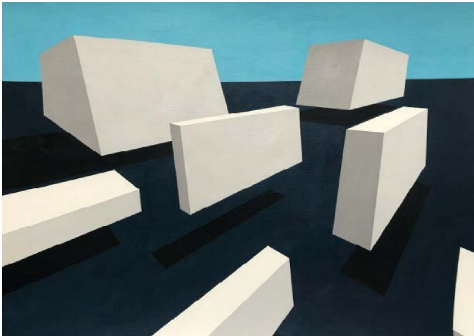
Nicolas PONCET Nuages de mer - 42X29,7 - Acrylique sur papier à grain toilé