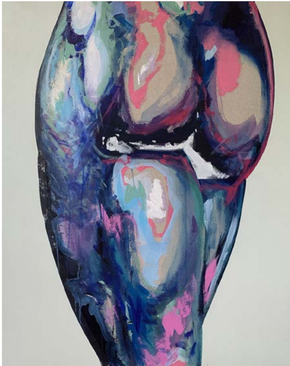
Samuel PERCHE DERRICK VARIATION 3- 80X100