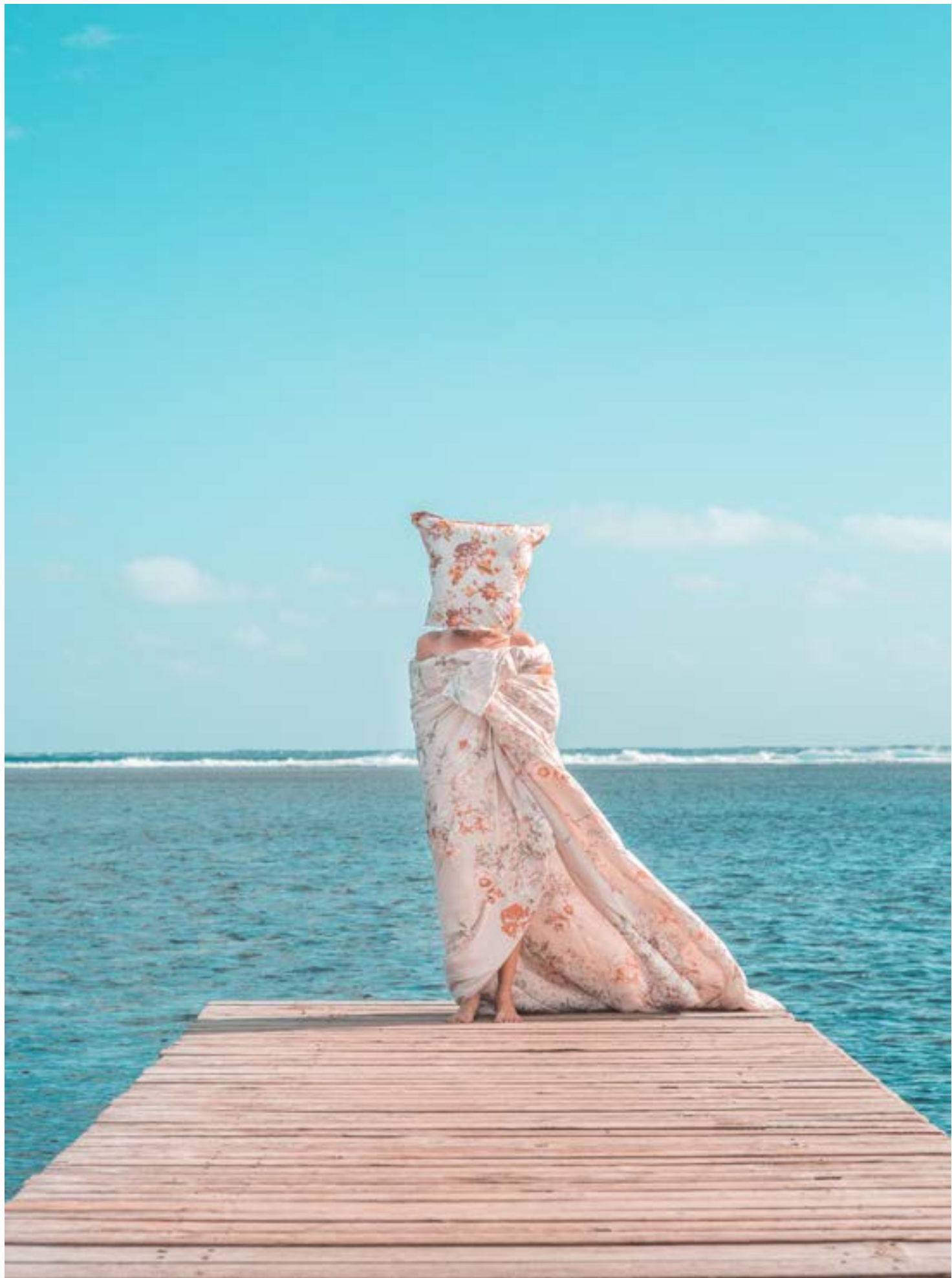
Le Paon Atypique Comme un Lundi - 40x60 - 700€ 15 ex - impression sur papier d'art