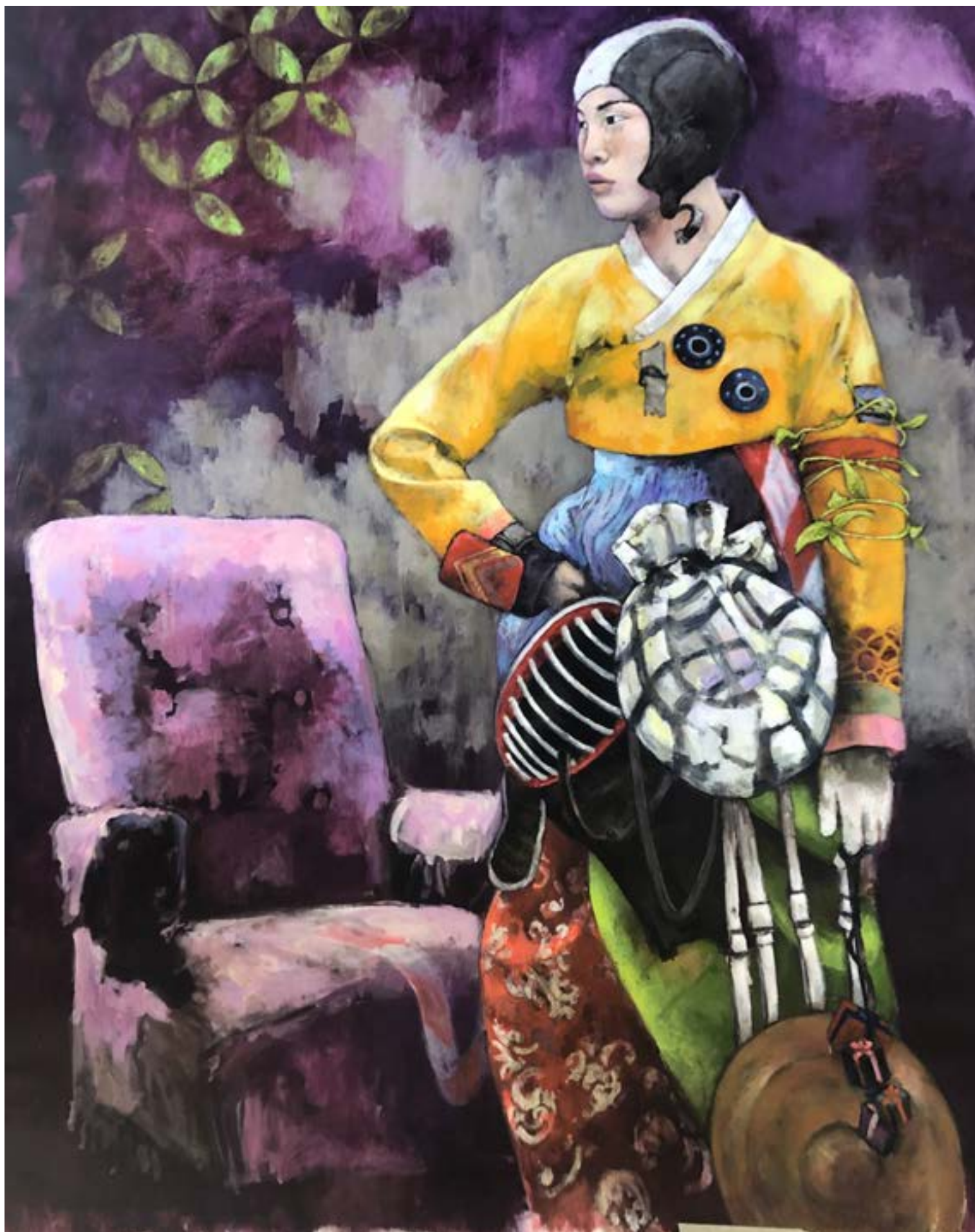
Eric Raban Fondation - 120X140 - Acrylique Acrylique sur toile