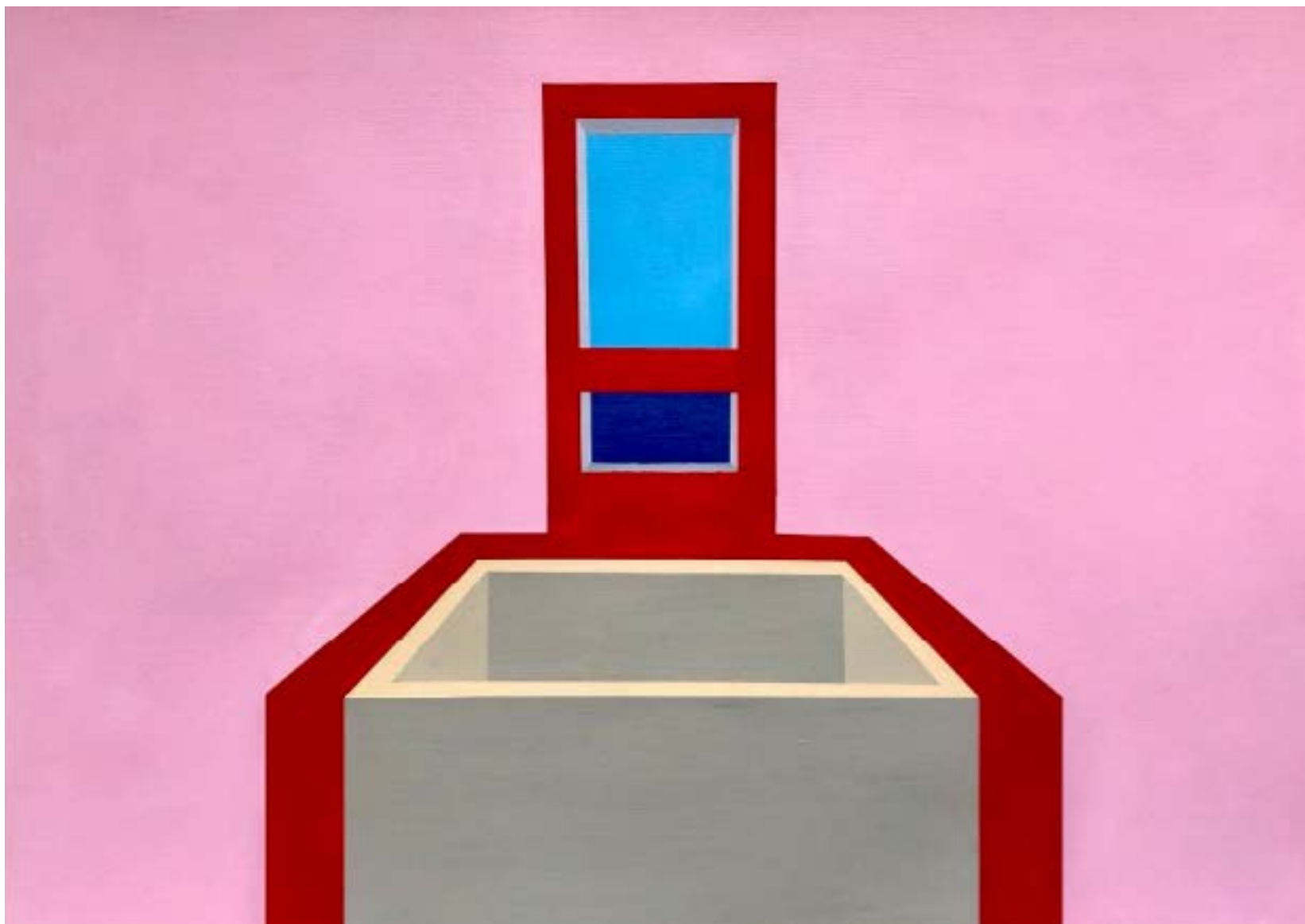
Nicolas PONCET Abolition Nostalgique- 42X29,7 - 600€ Acrylique sur papier à grain toilé