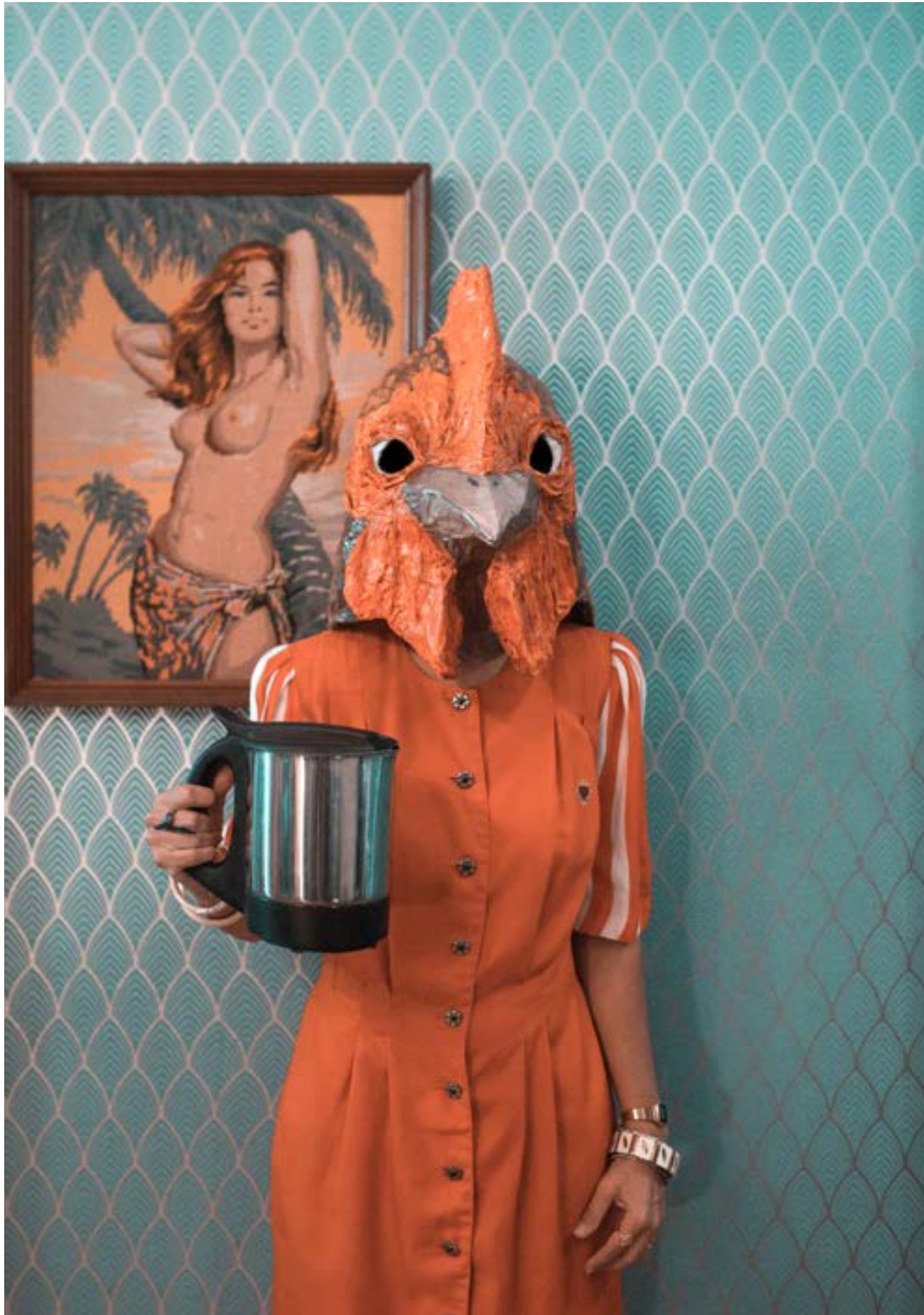
Le Paon Atypique Eveil paradoxal - 40x60 - 700€ 15 ex - impression sur papier d'art