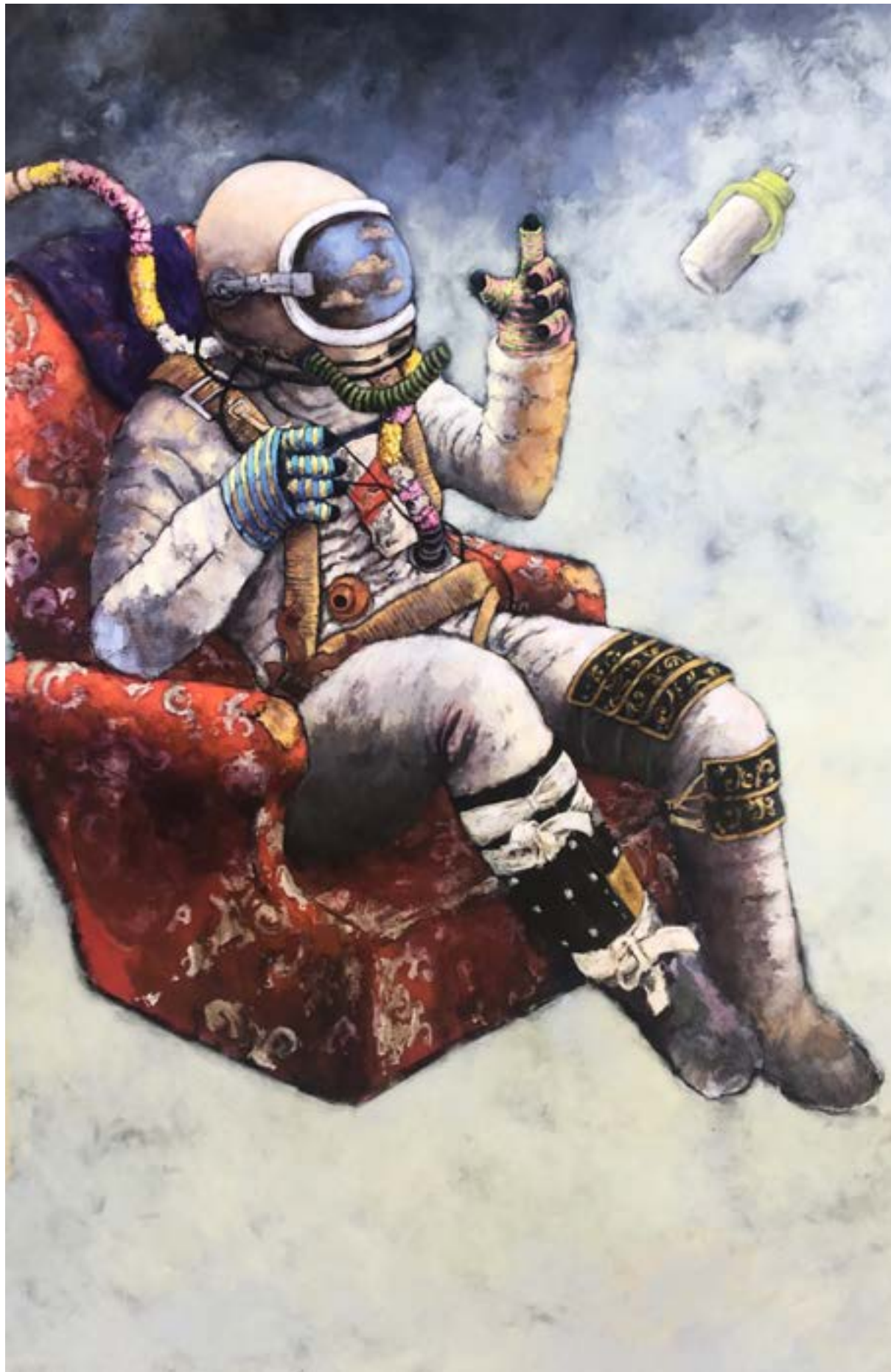
Eric Raban Recrudescence - 90X140 - Acrylique Acrylique sur toile