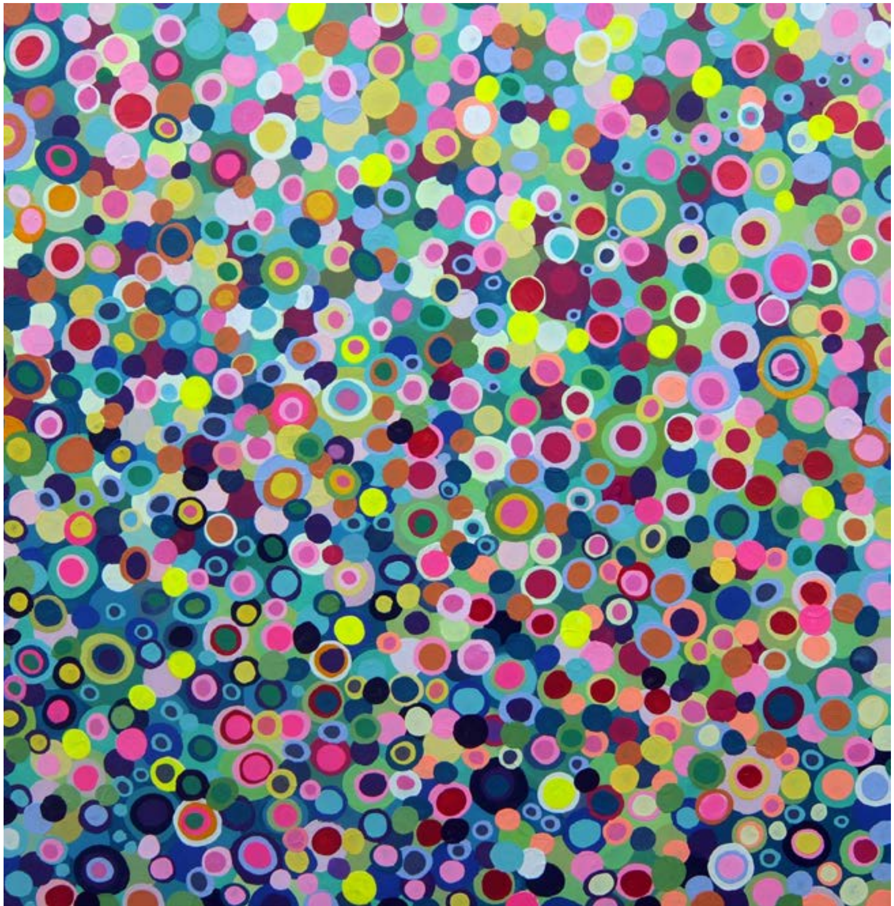
Lionel LAURET Mysteri Plutonium - 2700€ 100X100 Acrylique sur toile