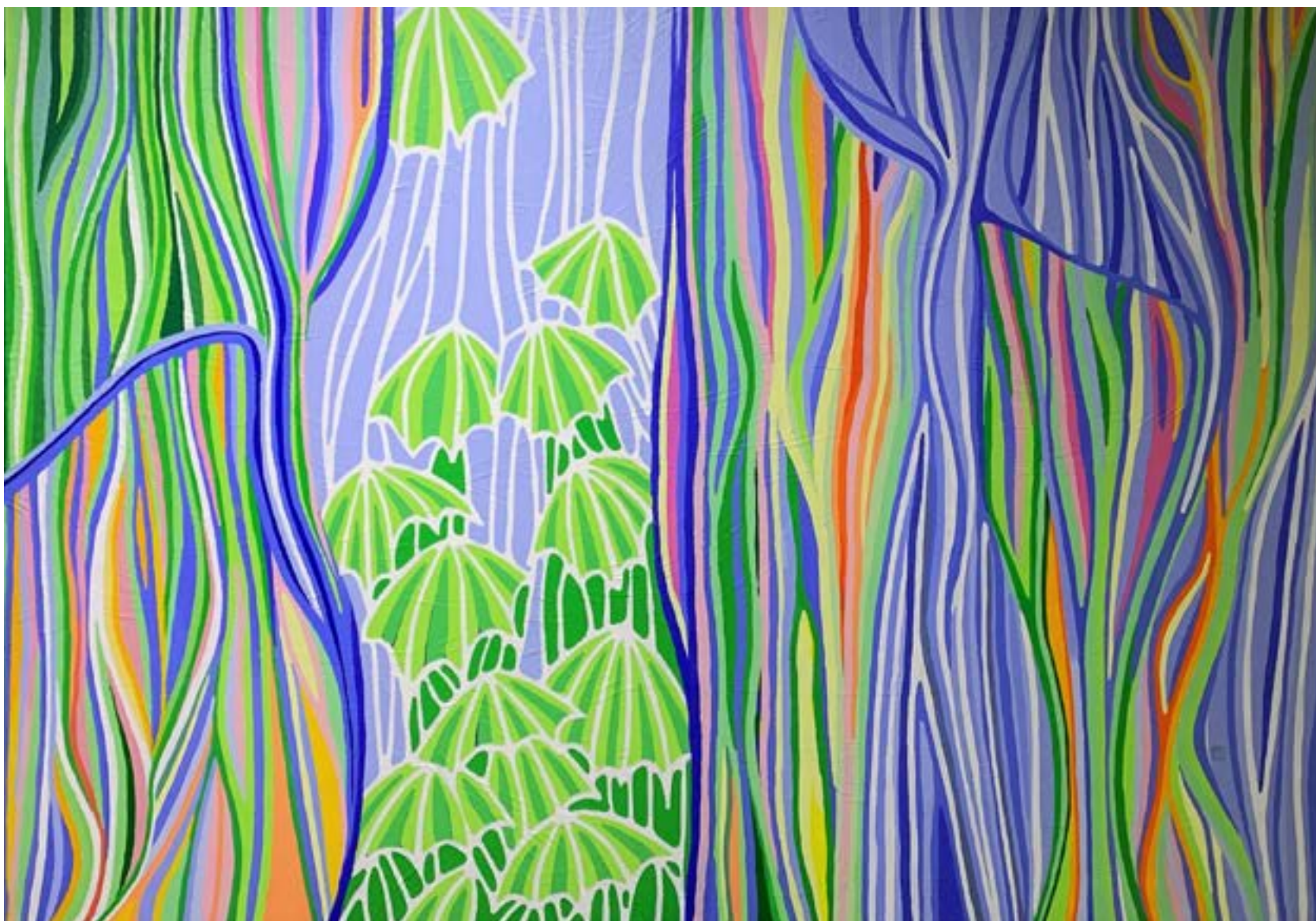
Christophe VERGÉ - RIVIÈRE DES PLUIES- 140X100 Acrylique sur toile 1500€