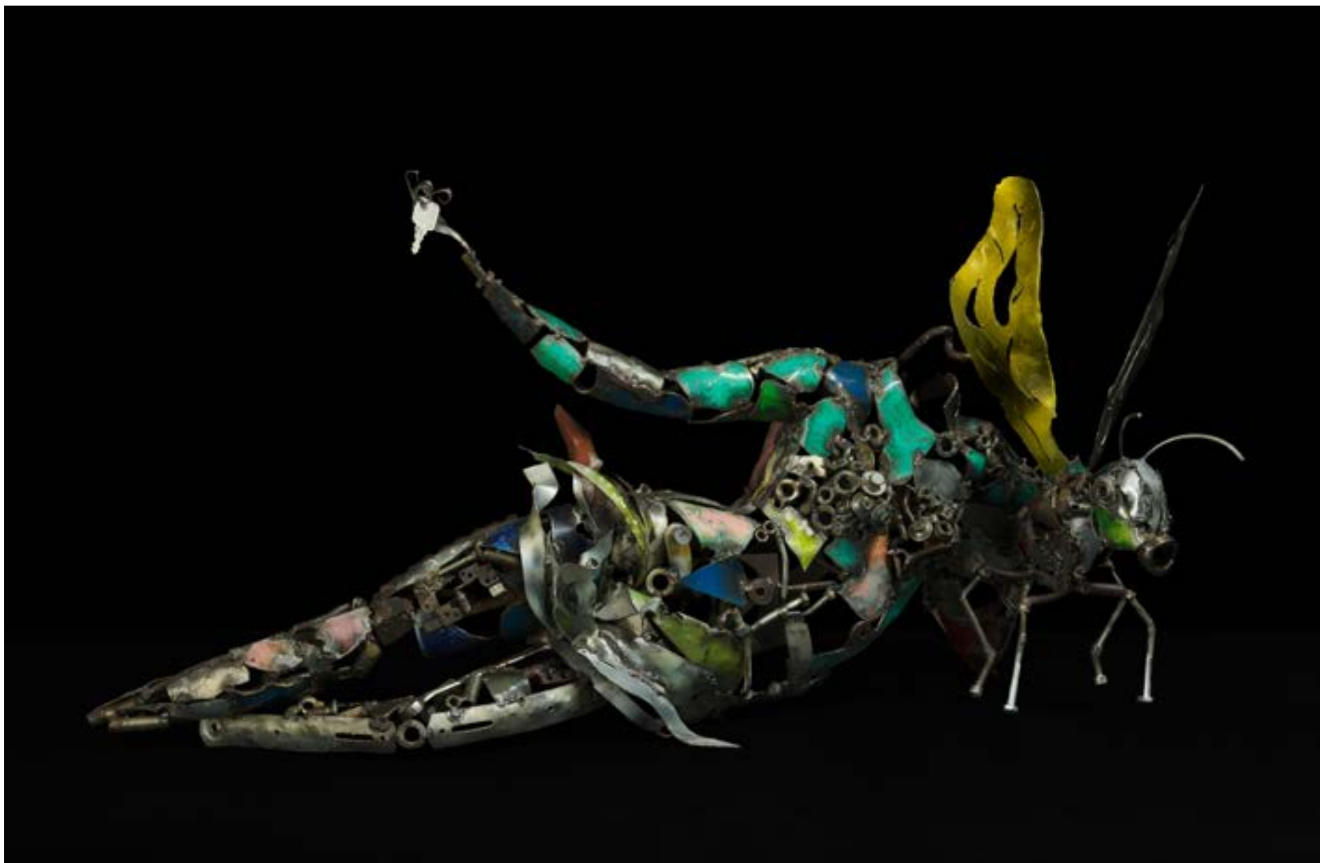
JO'M RBG sculpture fer