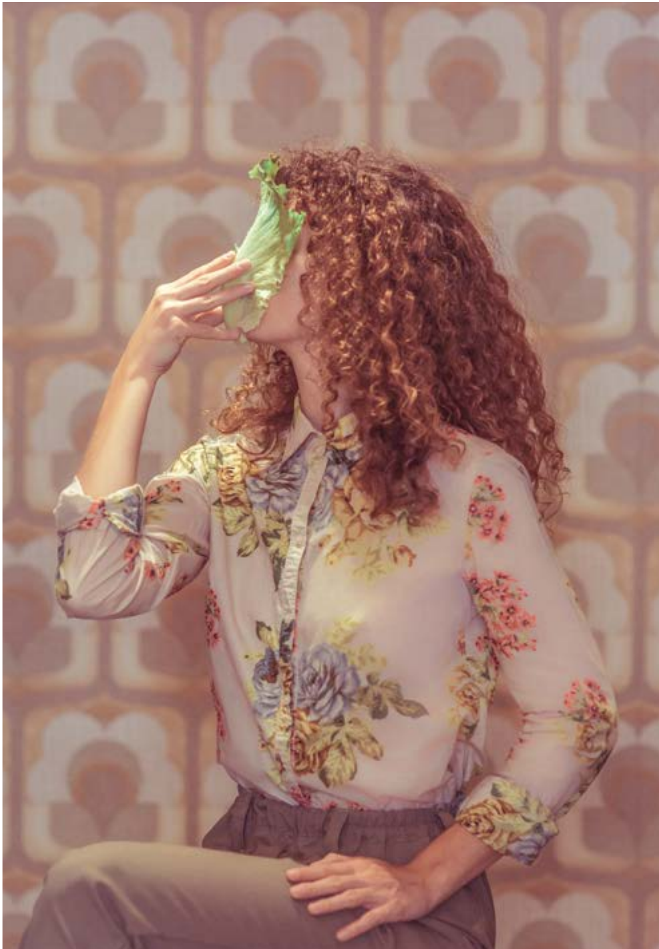
Le Paon Atypique Entrevue avec une laitue - 40x60 - 700€ 15 ex - impression sur papier d'art