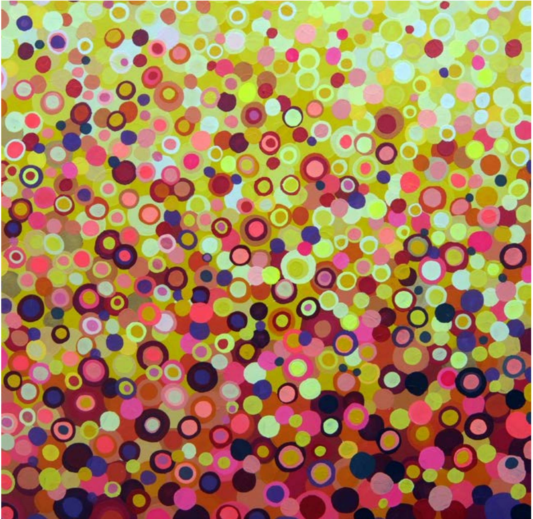
Lionel LAURET Yellow plutonium - 2700€ 100X100 Acrylique sur toile